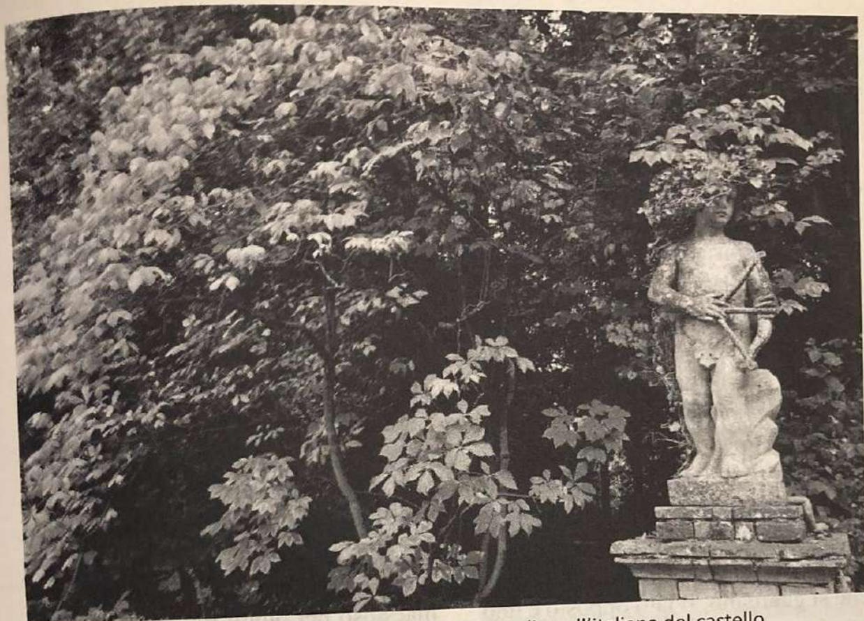
Il tipico putto grazzanese immerco nel verde del giardino all'italiana del castello

tana, tracciando un asse di simmetria immaginario creano due mezze lune che combaciano perfettamente con i due vani laterali che sono di dimensioni e forme identiche.