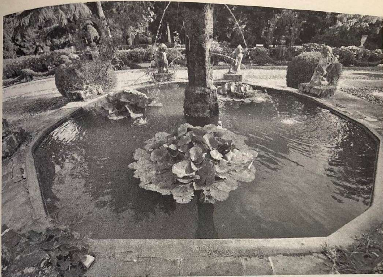
La fontana di Orfeo all'interno del giardino all'italiana del castello

metri. Il cancello d'ingresso in ferro battuto stile Grazzano, è sovrastato da due leoni e introduce al viale lungo il quale è possibile ammirare gruppi di statue posizionate specularmente con una panchina a sei posti tutta decorata con leoni alati.